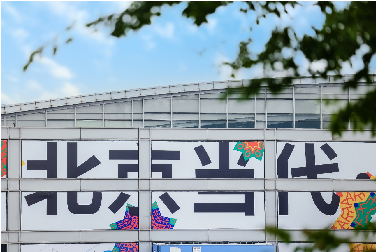
北京当代·艺术博览会 11 号馆外

2023 北京艺术品交易展示月以打造北京城市品牌为目标，助力首都艺术消费市场的繁荣发展，唤醒北京这座城市的文化活力和消费潜力。北京当代·艺术博览会作为多年深耕于北京的艺术交易与展示平台，同时也是“北京惠民文化消费季——2023 北京艺术品交易展示月”的重要组成活动，其开幕也标志着艺术品交易展示月的正式开启，精彩纷呈并兼具本土特色的惠民文化活动也将陆续展开。北京市国有文化资产管理中心赵恩国主任在现场致辞中说到：“2023 北京艺术品交易展示月以打造北京城市品牌为目标，助力首都艺术消费市场的繁荣发展，唤醒北京这座城市的文化活力和消费潜力。北京当代·艺术博览会作为多年深耕于北京的艺术交易与展示平台，将为北京惠民文化消费季带来如万花筒般精彩纷呈的艺术盛宴。北京市国有文化资产管理中心赵恩国主任在现场致辞中说到：“为全面提升北京艺术品交易的国际地位，推动艺术产业高质量发展，实现艺术品交易的新高度，促进艺术品市场